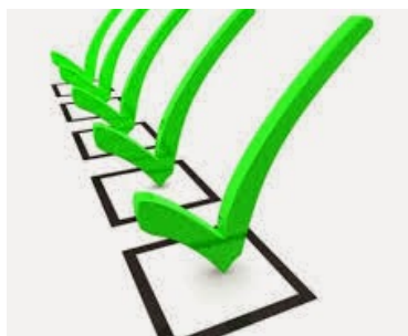
Verificación y Validación