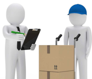
Auditorías de segunda parte a proveedores