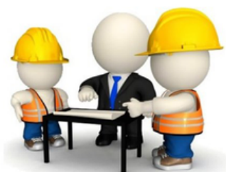
Reglamento de seguridad e higiene en el trabajo