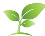
Licencias o certificados ambientales