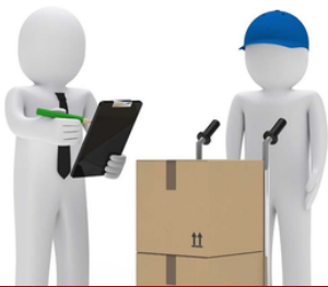
Auditorías de segunda parte a proveedores