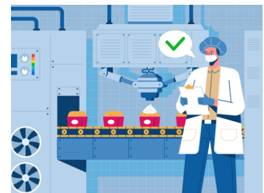
Cultura de inocuidad