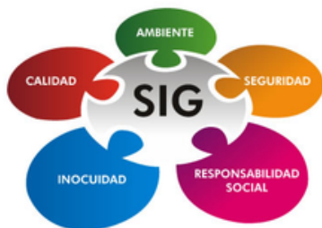
Auditorías internas de segunda parte a sistemas de gestión